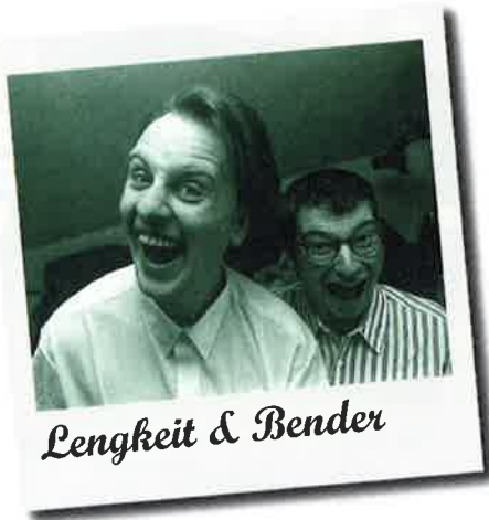
Lenglit & Bender