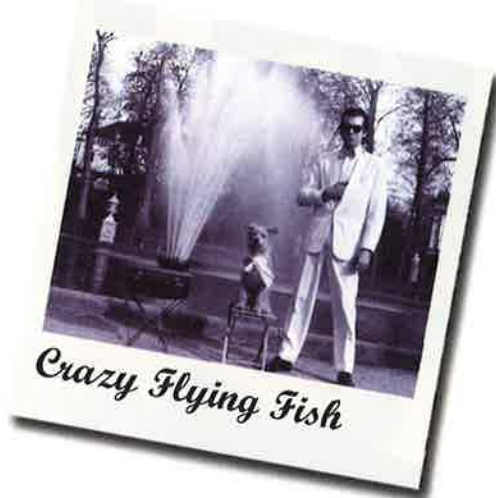
Crazy Flying Fish