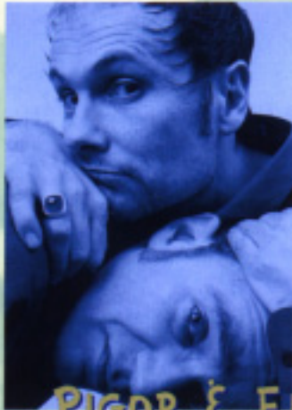
PIGOR & EICHHORN

Gigantischer Gaga, der zurecht den „Deutschen Kleinkunstpreis 2000“ bekommen hat. Hirnzerrung und akuter Wahnsinn garantiert. Sonntag 18 Uhr im Cafézelt.