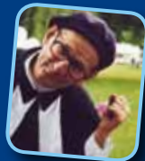
Dado: The Hunchback Ballet >