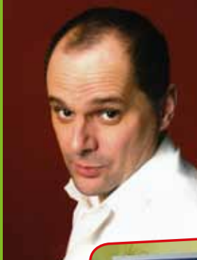
< Fabian Lau Klirr Deluxe >