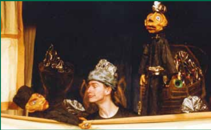
< Alibaba und die 40 Räuber

Musik, Mechanik, und andere Teufeleien >