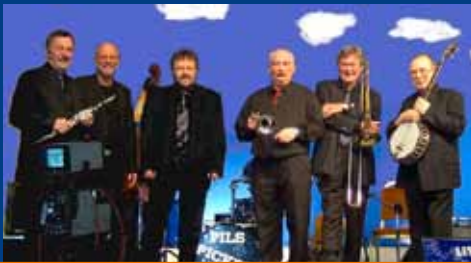
< Pilspicker Jazzband